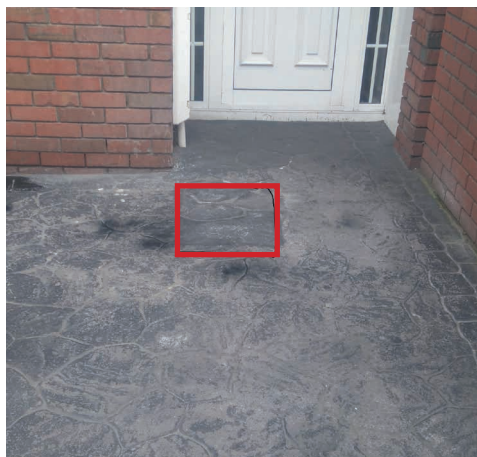
Временное восстановление на печатном бетоне.

«Газовые сети Ирландия» приложит все усилия для того, чтобы не повредить цветочные клумбы и газоны на вашей территории. Вместе с вами мы выберем лучший путь, чтобы избежать повреждения растений, цветов и газонов. Но, возможно, вы предпочтете временно удалить растения или цветы, во избежание ущерба вследствие непредвиденных обстоятельств. Мы с должным вниманием отнесемся к покрытым растительностью участкам, однако, возможно, избежать вытаптывания на лужайке или по краям не удастся, особенно, при плохой погоде. Если в ходе земляных работ пострадают участки, покрытые растительностью, наши сотрудники предпримут все необходимое для восстановления и даже засеют заново, если потребуется. Восстановление цветочных клумб и лужаек может быть отложено в связи с сезонными факторами.